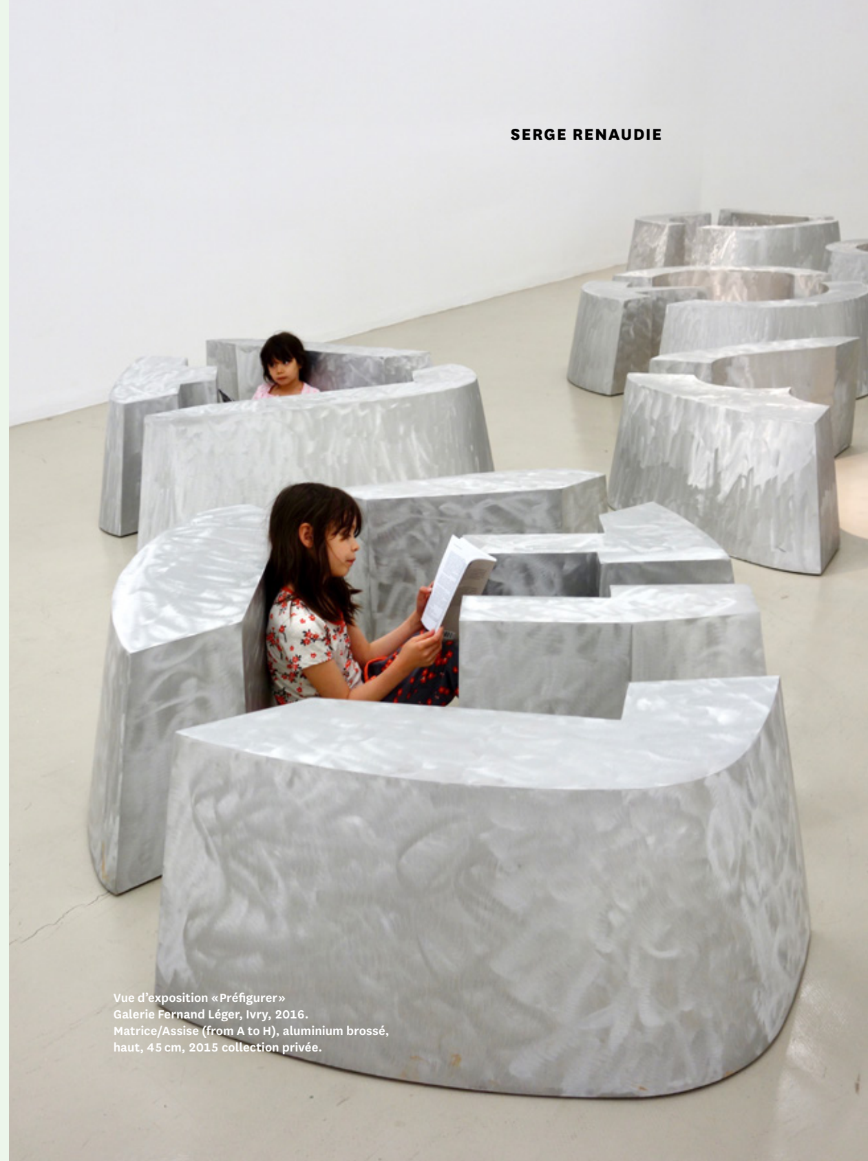
Vue d'exposition «Préfigurer» Galerie Fernand Léger, Ivry, 2016. Matrice/Assise (from A to H), aluminium brossé, haut, 45 cm, 2015 collection privée.