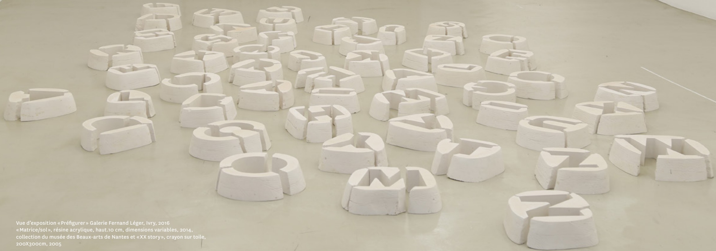
Vue d'exposition «Préfigurer» Galerie Fernand Léger, Ivry, 2016 «Matrice/sol», résine acrylique, haut.10 cm, dimensions variables, 2014, collection du musée des Beaux-arts de Nantes et «XX story», crayon sur toile, 200X300cm, 2005