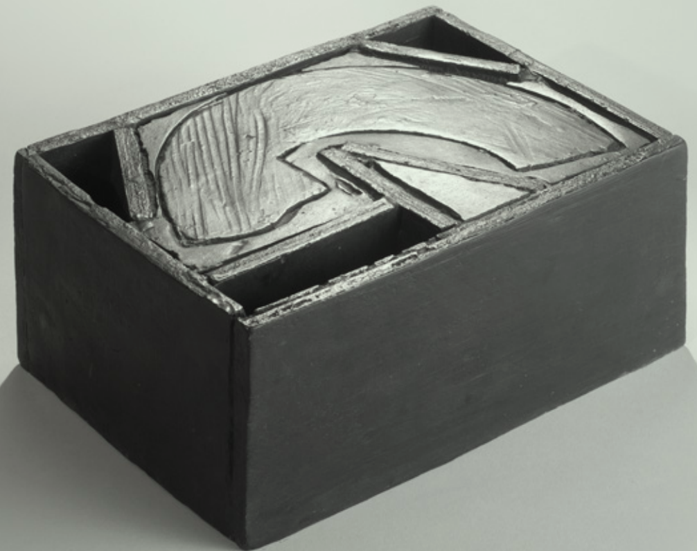
MDM #2 bronze ed.1/5 2015