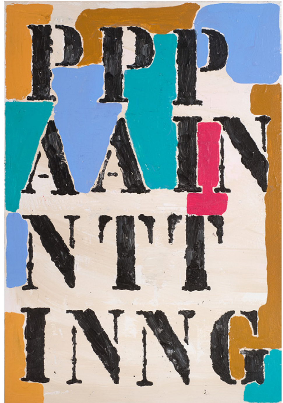
Page 65 - Prédelle (Painting), acrylique sur toile, 55X33cm, 2017

UN HÉRACLITISME LENT, MICHÈLE COHEN-HALIMI